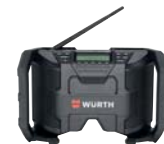
AKKUS RÁDIÓ RA 12-A KARTONDOBOZBAN Csz.: 5700 118 0